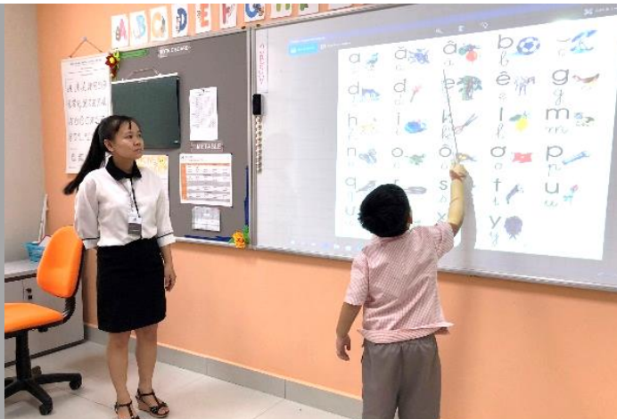
Học sinh đang thực hành phát âm – Lớp Coconut

Học sinh của cô Thủy và cô Đông lớp Coconut cũng được học về ngữ âm ABC và bắt đầu các bài tập về số như ghép từ cùng với số. Các em cũng được tham gia vào các lớp mỹ thuật như cắt dán giấy về các loài động vật thông qua các phương pháp khoa học.