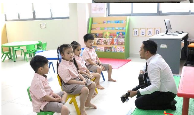
Các bé đang khám phá từ ngữ qua bài hát - Lớp 1 & 2

Ở lớp 1 và lớp 2, các học sinh của cô Quý và thầy Thành đang khám phá các từ thông qua âm nhạc với sự giúp đỡ của thầy German và với nhiều loại đàn guitar. Các em cũng đang học về bản thân và các thành viên gia đình với sự tích hợp số như “tôi cao bao nhiêu” và đặt câu hỏi như “Cô ấy là ai?” Tất nhiên, các giáo viên đang dạy cho học sinh kiến thức để cải thiện vốn từ vựng cũng như phát âm các nguyên âm đôi của các em ví dụ như sh oe, sh irt, fish and br ush.