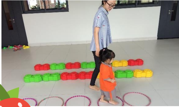
Học sinh đang thực hành kỹ năng vận động – Lớp Strawberry

Từ những ngày bắt đầu năm học mới, cả giáo viên và học sinh đều rất năng động ở lớp.