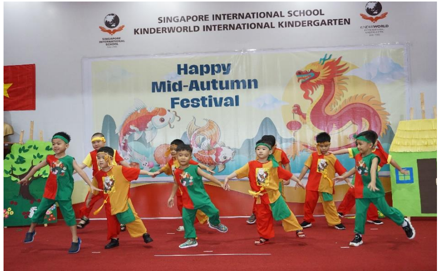
Các em học sinh biểu diễn các tiết mục văn nghệ vào dịp Trung Thu