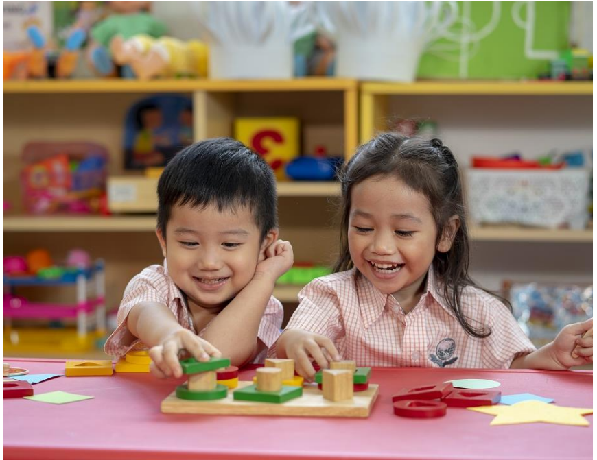
Vui chơi học tốt tại Trường Quốc tế Singapore