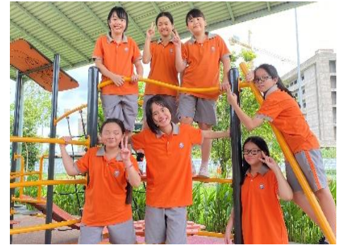
Học sinh Lớp 6 chụp ảnh cùng nhau vào giờ giải lao (hình dưới).