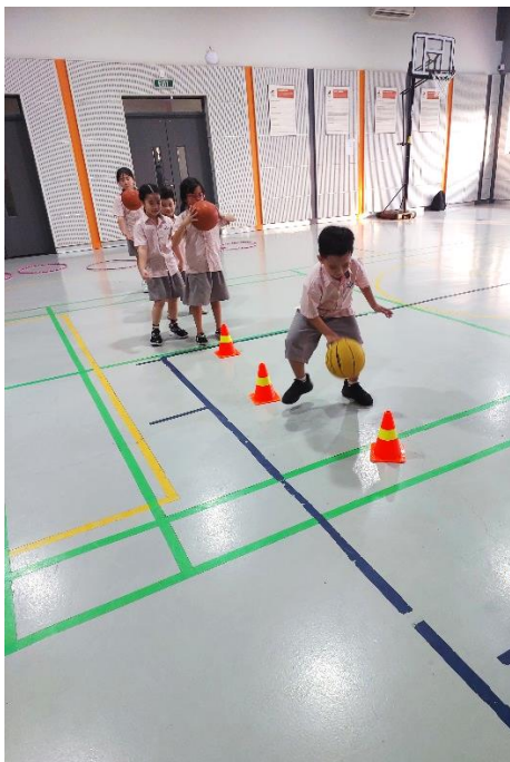
Trò chơi, Hoạt động trong nhà sau giờ học cho phép học sinh thực hành nhiều hoạt động, chẳng hạn như rê bóng.

Giải thưởng SWLG của nhà trường dành cho những học sinh học tập chăm chỉ nhất và đạt thành tích cao nhất. Những em học sinh đạt thành tích tháng này như sau: