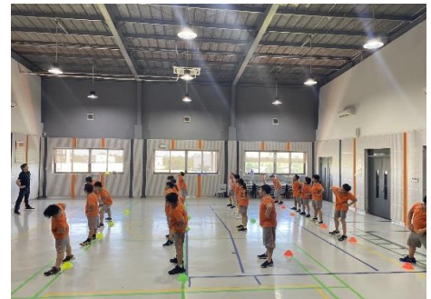
Các em học sinh Lớp 6 khởi động trong giờ thể dục với thầy Julius (hình dưới).