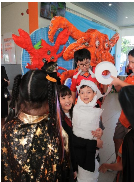
Hiên Vinh Lớp 1 tham gia trò chơi quần xác ướp tại Lễ hội Halloween.