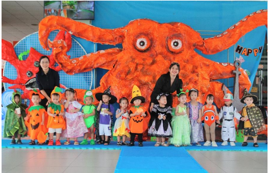
Lễ Halloween – Học sinh Lớp Nursery trình diễn những bộ trang phục đáng yêu