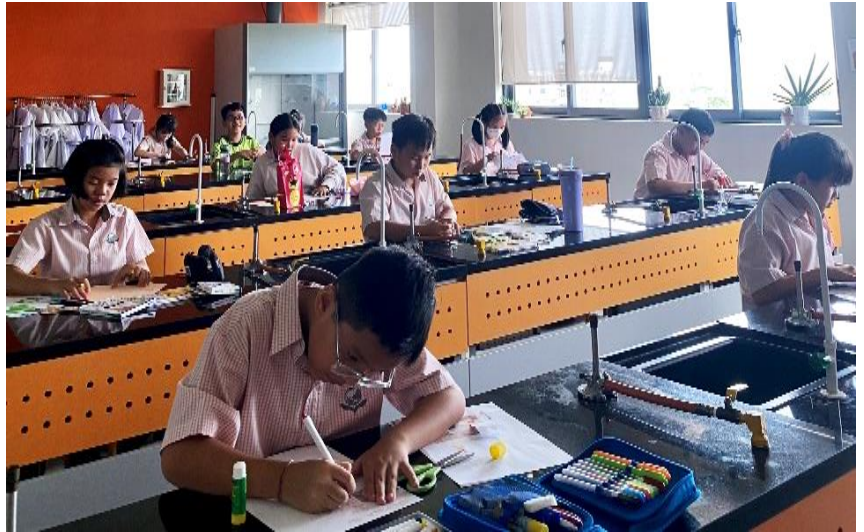
Trường quốc tế Singapore tại Cần Thơ